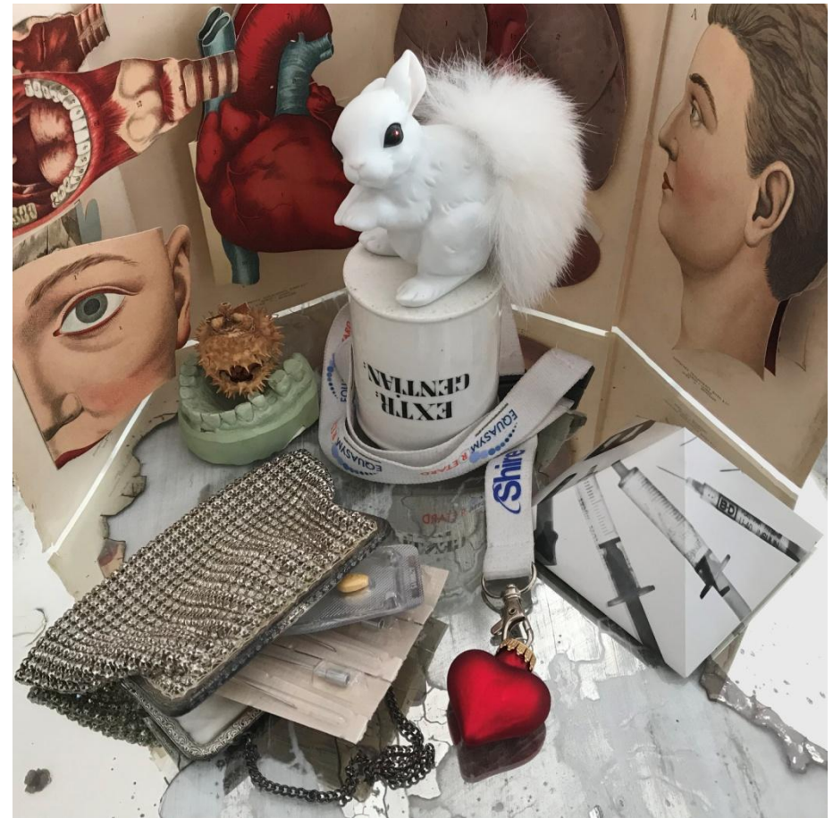
“Un-Birthday Gifts Table (White Rabbit on Extr. Gentian) II”, 2018, objets trouvés, historische Publikationen und Fotogramm-Pyramide, Maße gesamt ca. 30 x 35 x 35 cm