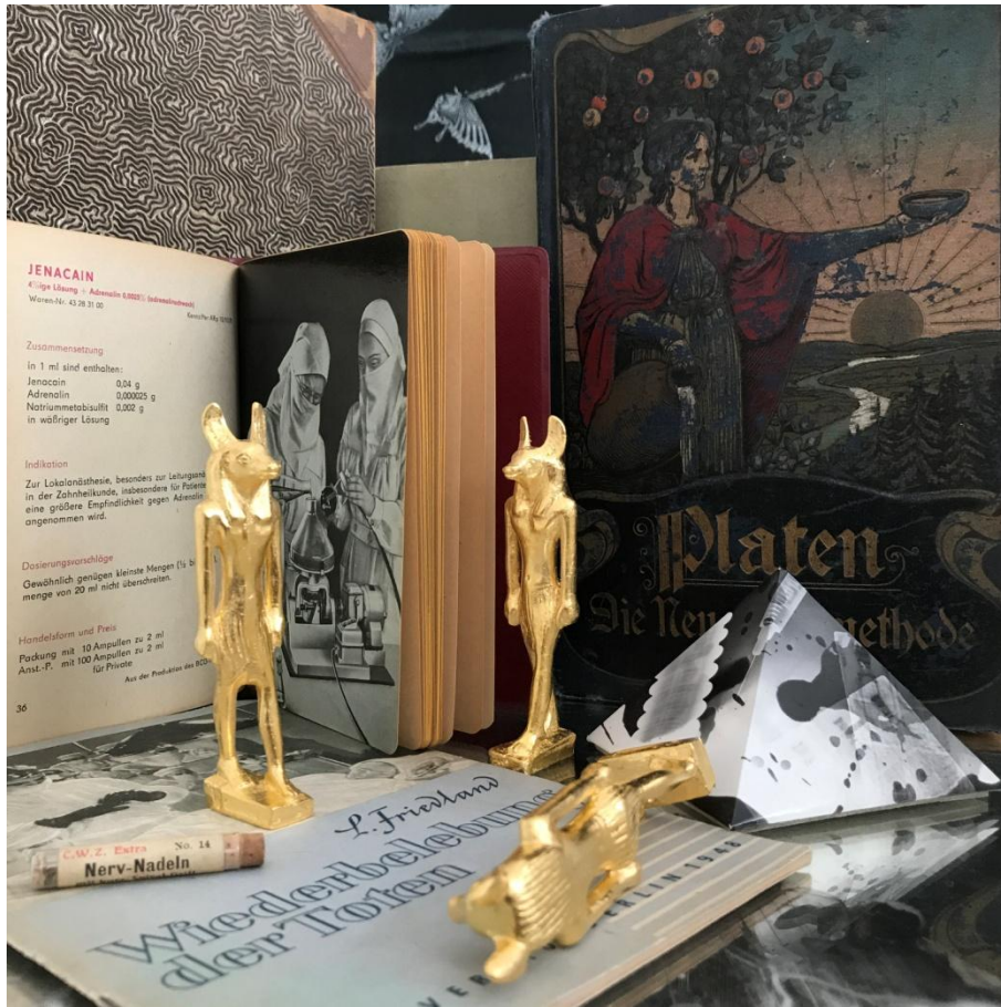
„Jenacain (Wiederbelebungs der Toten)“, 2018, objets trouvés (historische Publikationen), Fotogramm-Pyramide und 24-karätig vergoldete Gipsrepliken einer antiken Anubis-Bronzemiinatur, Maße gesamt ca. 40 x 35 x 35 cm