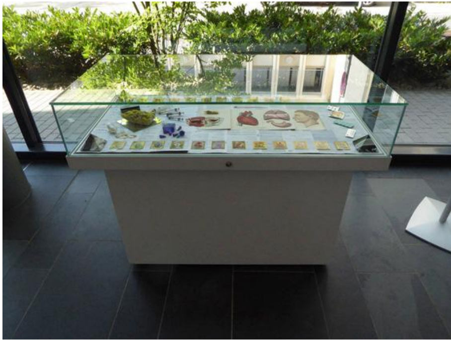
“LYRICA 2017 logical brain drain (serene vitrine)”